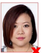
Haar verdeckt Auge/Gesicht