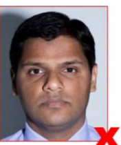
Hintergrund mit Schatten